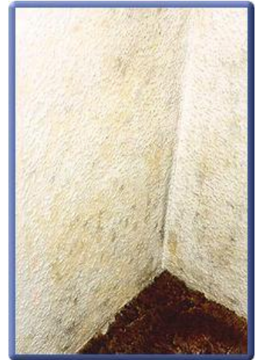
Beispiel eine Raumecke mit Schimmelbefall

Eine Beseitigung des Schimmelbefalls ist oft nur durch eine vollständige Trockenlegung und eine teilweise Entfernung belasteter Materialien möglich. Ist eine Schimmelbelastung durch falsche Belüftung entstanden, muss der Untergrund nach Entfernung der belasteten Materialien behandelt und neu aufgebaut werden. Manchmal ist der Einsatz von Fungiziden nicht zu vermeiden. Ein beträchtlicher Nachteil der Fungizide ist, dass sie gesundheitsschädlich sind und die Pilz-Plage nur vorübergehend beseitigen können.