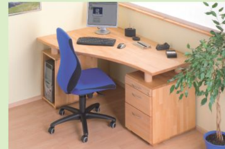
TISCH HOME OFFICE, HIER IN BUCHE GEÖLT

Gesundes Umfeld – zertifiziert. Wir sind vom eco-Umweltinstitut geprüft. Alle unsere Produkte sind „baubiologisch empfohlen“.