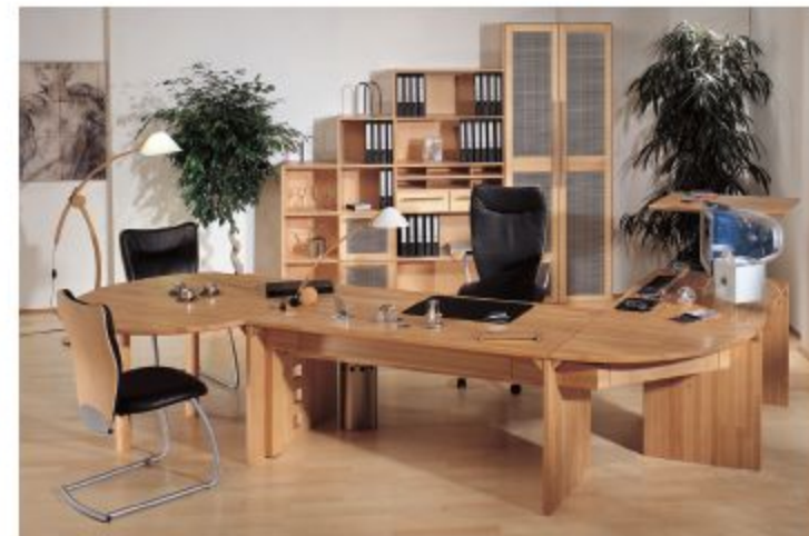
SCHREIBTISCH, HIER IN BUCHE GEÖLT. BÜROWAND MIT FÜLLUNGEN IN EDELSTAHL-LOCHBLECH.