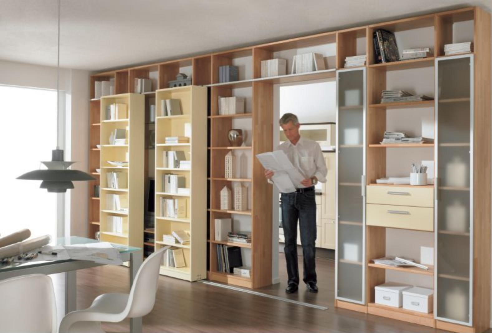
REGALELEMENTE, HIER IN BUCHE NATUR GEÖLT, SCHIEBEELEMENTE CREME-WEISS GEBEIZT, ALLURAHMENTÜREN GLAS SATINATO

Arbeiten oder Wohnen? Warum nicht beides? Mit dem Einsatz von Schieberegalen stehen Ihnen alle Möglichkeiten offen: geben Sie den Durchgang frei in andere Räume oder schließen Sie ihn gewollt – oder lassen Sie Ihre Arbeitsutensilien abends und am Wochenende einfach verschwinden. Wie so oft sind es die Details, die kleinen Feinheiten, die dem Ganzen das Besondere verleihen.