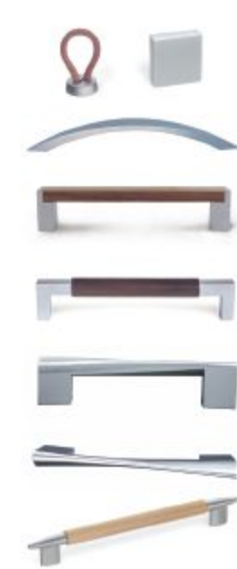
DIES IST NUR EINE KLEINE AUSWAHL UNSERES VARIANTENREICHEN ANGEBOTES AN FARBEN, MATERIALIEN UND GRIFFEN.

Natürliche Oberflächen für ein gesundes Raumklima.