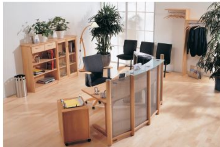
THEKE, HIER IN BUCHE GEÖLT, EDELSTAHL-LOCHBLECH UND GLASAUFSATZ SATINATO

Chef-Büro | Eine ansprechende Kombination, die (Frei)Raum bietet und somit konzentriertes Arbeiten unterstützt.