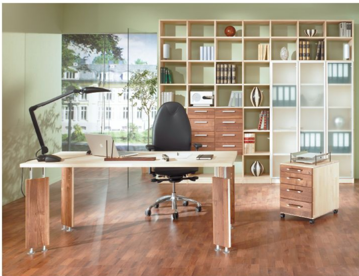
VIVENDO-BÜRO, HIER IN BIRKE WEISS, PIGMENTIERT GEÖLT, KOMBINIERT MIT NUSSBAUM UND ALURAHMENTÜREN GLAS SATINATO

Bei TREND stehen Funktionalität und Design im Vordergrund, um ein behagliches Zuhause zu gestalten. Unser Baukastensystem bietet unendlich viele Möglichkeiten, Ihre Möbel in Form und Funktion individuell anzupassen. Jedes einzelne Element ist gut durchdacht, kann variiert, umgebaut und jederzeit nachträglich ergänzt werden. Dies gilt sowohl für die Einrichtung Ihrer Wohn- als auch Ihrer Arbeitsräume. Die sorgfältige Auswahl der Hölzer und deren schöne Oberfläche strahlen eine Harmonie aus, in der man sich gerne auch einmal vom Alltag zurückzieht um sich rundum wohl zu fühlen – beim Arbeiten, Wohnen und Leben.