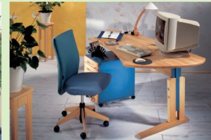
TISCH ALLEGRO MIT ROLLCONTAINER, HIER IN BUCHE GEÖLT, AKZENTE IN FARBE, STUHL NATURA PUR