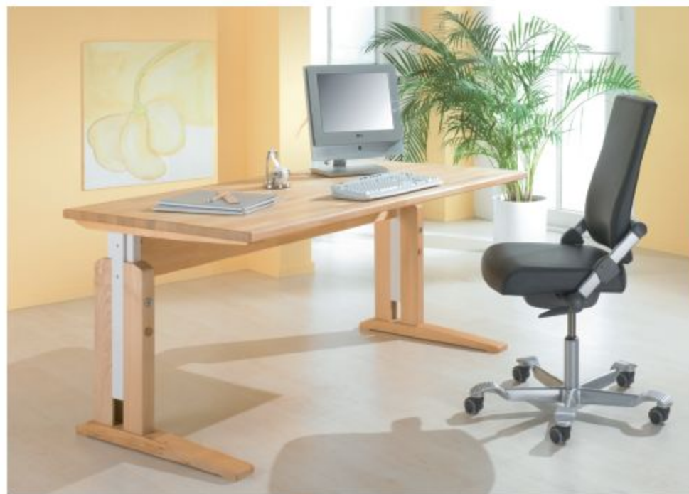
SCHREIBTISCH MIT C-FUSS, HIER IN BUCHE GEÖLT, AKZENTE IN WEISS

Mit dem höhenverstellbaren C-Fuß können Sie die Tischhöhe Ihren individuellen Anforderungen an die Ergonomie anpassen.