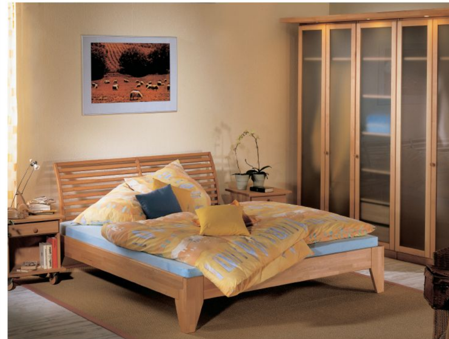
BETT „LEA“ MIT SPROSSENKOPFTEIL, SCHRANK MIT RAHMEN TÜREN UND GLASFÜLLUNGEN SATINATO, HIER IN BUCHE NATUR GEÖLT

Bei TREND stehen Funktionalität und Design im Vordergrund, um ein behagliches Zuhause zu gestalten. Unser Baukastensystem bietet unendlich viele Möglichkeiten, Ihre Möbel in Form und Funktion individuell anzupassen. Jedes einzelne Element ist gut durchdacht, kann variiert, umgebaut und jederzeit nachträglich ergänzt werden. Dies gilt sowohl für die Einrichtung Ihrer Wohn- als auch Ihrer Arbeitsräume. Die sorgfältige Auswahl der Hölzer und deren schöne Oberfläche strahlen eine Harmonie aus, in der man sich gerne auch einmal vom Alltag zurückzieht um sich rundum wohl zu fühlen – beim Arbeiten, Wohnen und Schlafen.