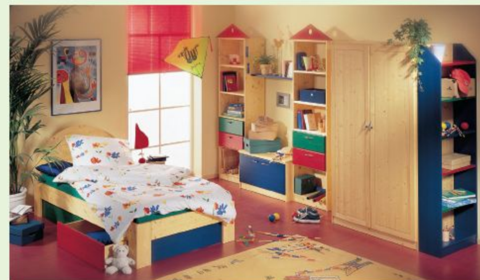
KINDERZIMMER, HIER IN FICHTE MASSIV, FARBLOS GEÖLT MIT FARBIGEN AKZENTEN.

Ihr Wunschmöbel können Sie in Material, Farbe, Form und Innenleben völlig individuell zusammenstellen oder vorhandene Kombinationen jederzeit verändern und erweitern.