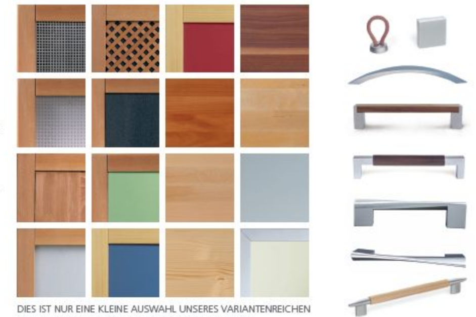
DIES IST NUR EINE KLEINE AUSWAHL UNSERES VARIANTENREICHEN ANGEBOTES AN FARBEN, MATERIALIEN UND GRIFFEN.

Alle TREND System-Möbel werden individuell angefertigt: Wählen Sie zwischen 200 RAL-Farben, 20 verschiedenen Griffen sowie unterschiedlichen Glasarten und Glasfarben. Wir verarbeiten ausschließlich Holz aus nachhaltiger Forstwirtschaft. In Kombination mit weiteren Werkstoffen wie Glas und Metall kann die attraktive Oberflächenstruktur des Naturmaterials noch betont werden. Sie haben die Wahl zwischen massiver Fichte, Buche, Birke, Nussbaum und Kirsche .