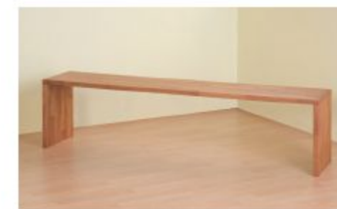
EINHÄNGBARER NACHTTISCH UND SITZBANK, DIE SCHNELL ZU EINEM TÄGLICHEN BEGLEITER WERDEN.