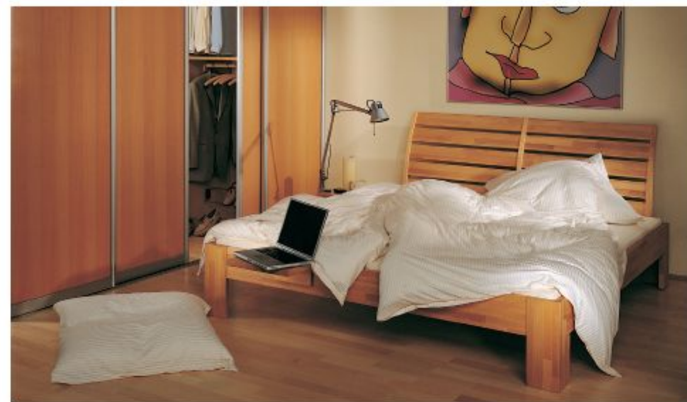
BETT „EVA“ MIT LAMELLENKOPFTEIL, METALLFREI, HIER IN BUCHE MASSIV GEÖLT