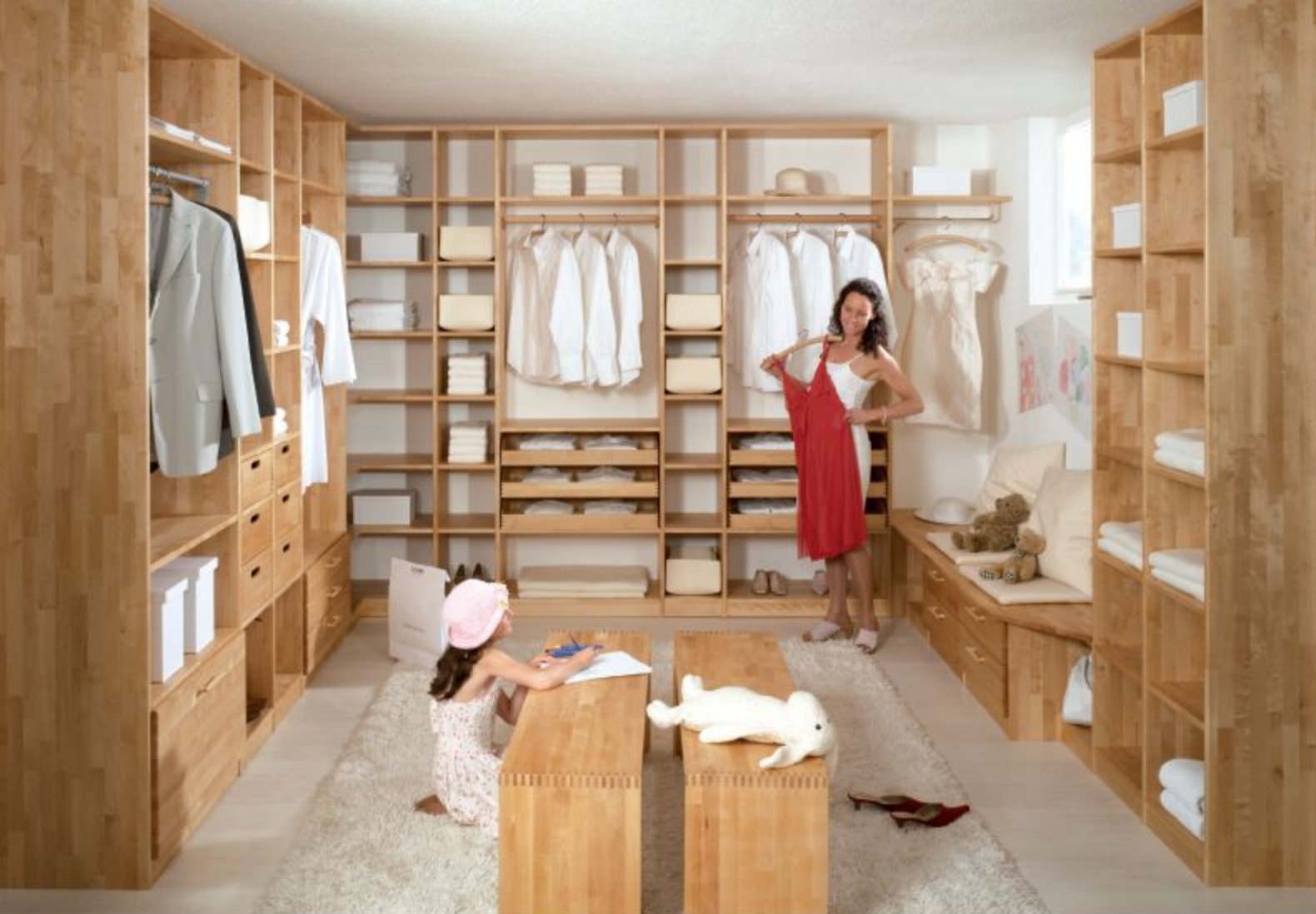
BEGEHBARER KLEIDERSCHRANK, HIER IN BIRKE NATUR GEÖLT