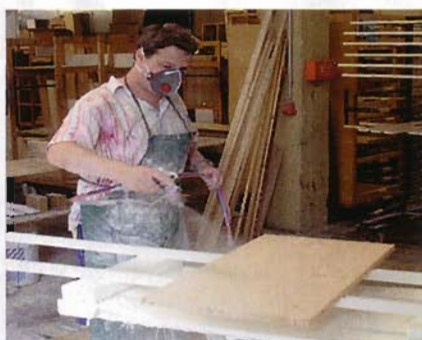
Trend produziert sehr schlank. Die fertig formatierten und gebohrten Möbelteile werden im Werk nur noch geschliffen und mit Öl und Wachs behandelt